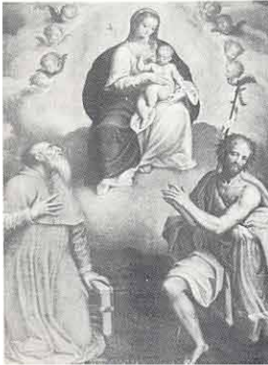
Chiesa parrocchiale, Bernardino Campi: Madonna col Bambino e Santi (olio su tela)

E cominciamo dal campanile, con la sua struttura poderosa e rozza, della stessa epoca della chiesa una struttura evidentemente alterata dalla conica cuspidi di coronamento, certamente aggiunta in un secondo tempo, forse nel 1726, quando nei libri contabili della parrocchia si registrano spese sostenute per la "fabbrica della torre" e, nel 1739, spese per la "fabbrica della nuova chiesa": certamente non "nuova" perché si parla di cambi di travetti, di intonaco, ecc. Nella struttura originaria dell'edificio, la torre, come in tutte le chiese, era nella zona adiacente l'altare. per comodità liturgica; con la ristrutturazione del 1939, venne ovviamente a trovarsi in