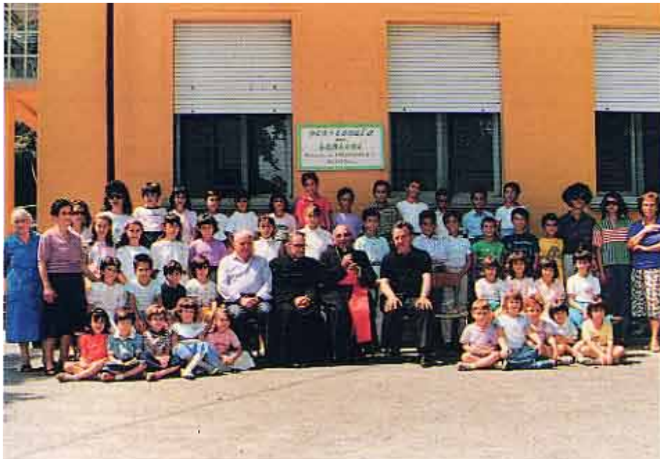
Tornolo, la Colonia per bambini di Frescarolo viene visitata dal Cardinale Agostino Casaroli (al centro della foto) nel 25° di fondazione dell'Ente (13 agosto 1988)

La popolazione locale è sempre stata affettuosamente ospitale e generosa con i bambini; in modo particolare lo è sempre stato il parroco don Vico Bergamaschi, al quale va tutta la riconoscenza dei frescarolesi che, per mezzo suo, desiderano estenderla a tutta la comunità del luogo. Perché a Tornolo i bambini della Colonia si sentono veramente in famiglia.