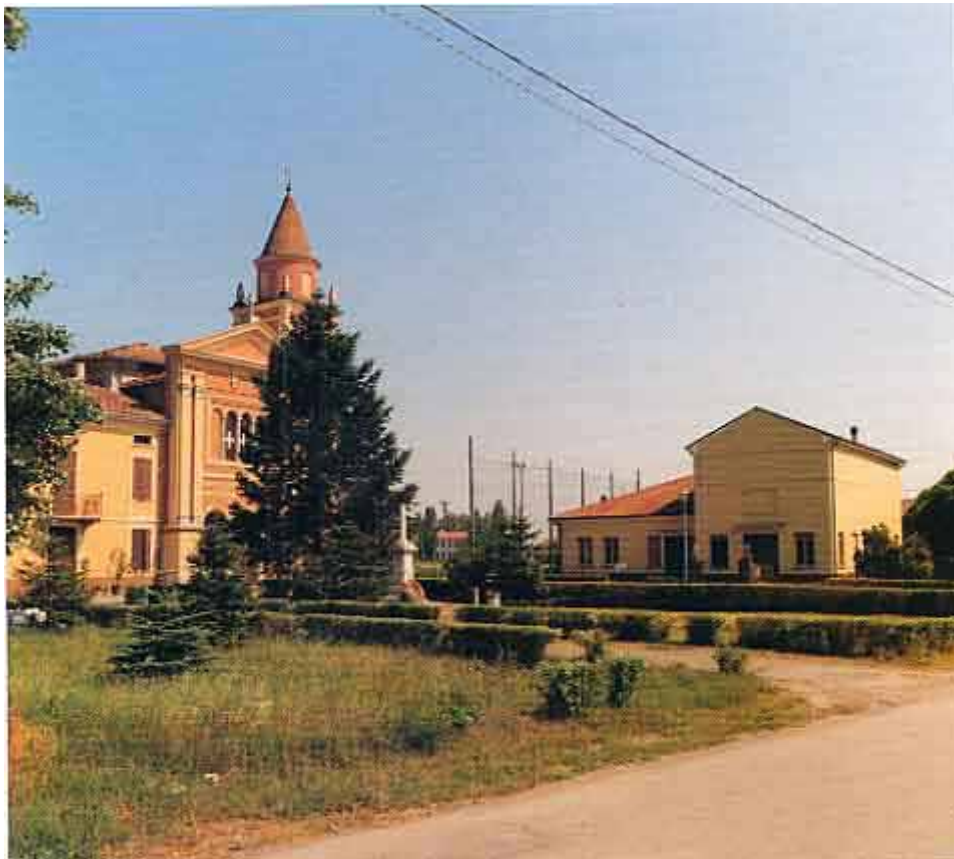
Frescarolo, l'edificio della Scuola Materna parrocchiale