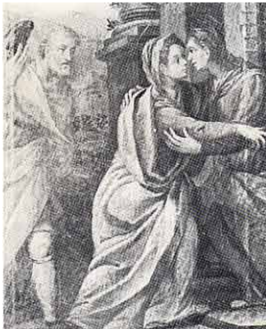
Scuola cremonese del sec. XVI: La Visitazione (olio su tela).

E cominciamo dal campanile, con la sua struttura poderosa e rozza, della stessa epoca della chiesa una struttura evidentemente alterata dalla conica cuspidi di coronamento, certamente aggiunta in un secondo tempo, forse nel 1726, quando nei libri contabili della parrocchia si registrano spese sostenute per la "fabbrica della torre" e, nel 1739, spese per la "fabbrica della nuova chiesa": certamente non "nuova" perché si parla di cambi di travetti, di intonaco, ecc. Nella struttura originaria dell'edificio, la torre, come in tutte le chiese, era nella zona adiacente l'altare. per comodità liturgica; con la ristrutturazione del 1939, venne ovviamente a trovarsi in