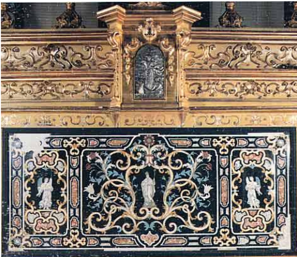
Frescarolo, Chiesa parrocchiale - Palio d'altare in gesso di Carpi. del 1700