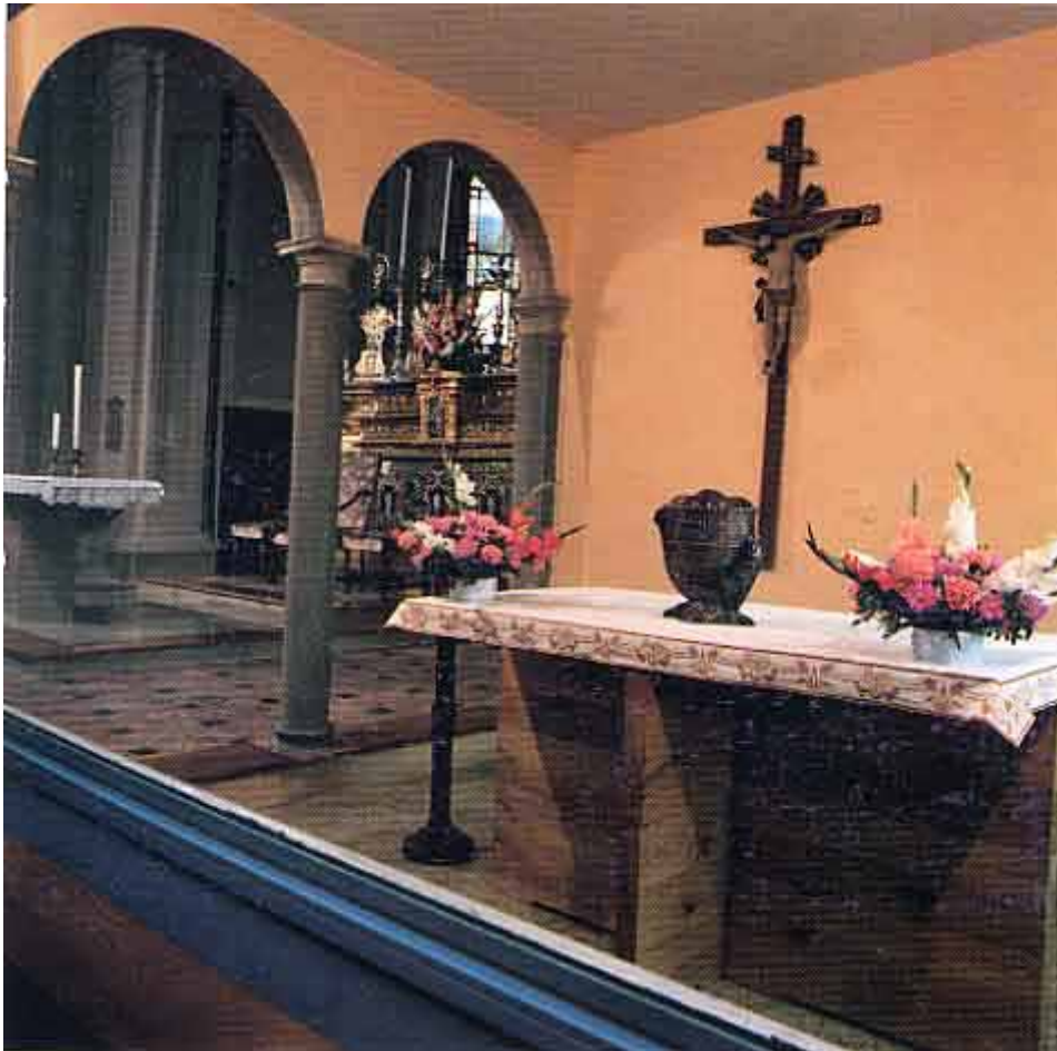
Frescarolo, Chiesa parrocchiale - la Cappella dell'Adorazione e, sullo sfondo, il presbiterio.