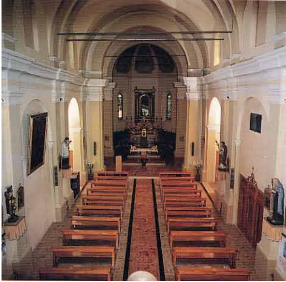
Frescarolo, Chiesa parrocchiale – l'interno