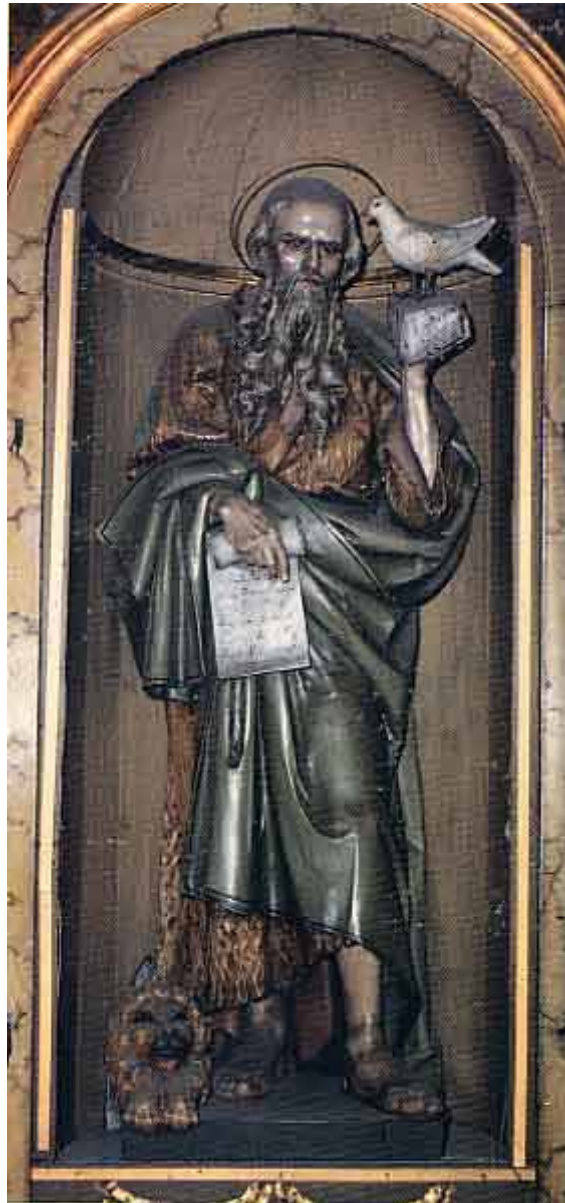
Frescarolo, Chiesa parrocchiale: la statua del patrono S. Girolamo, Confessore e Dottore della Chiesa. E' in legno policromo di Val Gardena ed è collocata nella nicchia centrale sopra il coro.

Entrando in chiesa, si può rilevare subito una curiosa particolarità: come molti edifici sacri dell'epoca, gli zoccoli dei pilastri sono di differente altezza, più alti a destra (cm. 82), più bassi a sinistra (cm. 60). Ugualmente diversa è la distanza del cornicione dal pavimento. Non si tratta di errori di progettazione o di esecuzione (... anche allora i muratori si servivano del metro!) ma questa apparente sfasatura architettonica riflette una ricorrente idea religiosa del tempo: la perfezione doveva essere solo di Dio.