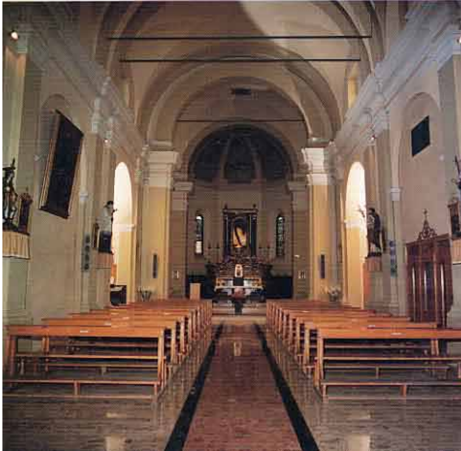
Frescarolo, Chiesa parrocchiale - L'interno.