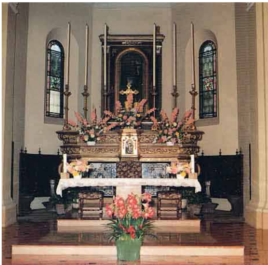
Frescarolo, Chiesa parrocchiale –Il presbiterio e il coro.