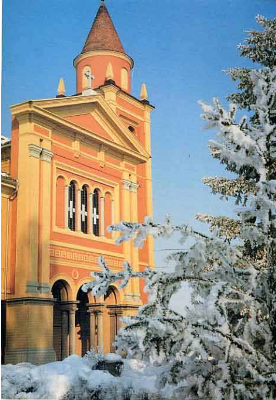
Frescarolo, Chiesa parrocchiale – Una suggestiva veduta invernale